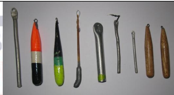
Ilustración 2: Profundizadores y flotadores

Dentro de los flotadores están los de madera, espina de algarrobo, plumas, etc.